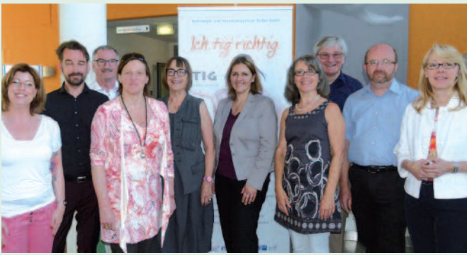
AG-Treffen in Gießen